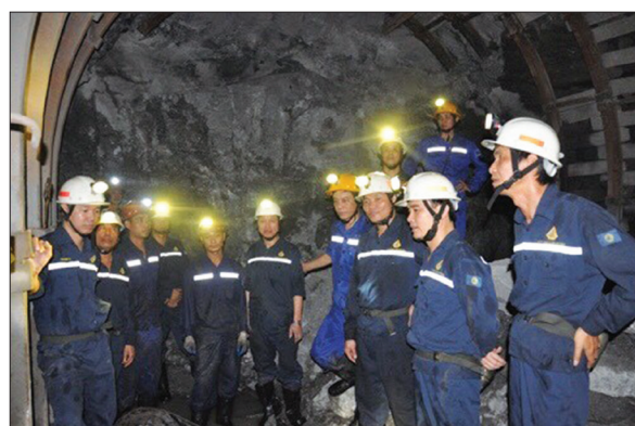
Công ty Cổ phần than Mông Dương là niềm tự hào của nhiều thế hệ thợ mỏ Mông Dương.

Bước sang quý III/2022, Than Mông Dương tiếp tục đặt ra các mục tiêu trọng tâm, đó là: Công tác an toàn, môi trường làm việc được cải thiện và đảm bảo. Không để xảy ra sự cố loại 1, tai nạn lao động nghiêm trọng và chết người; tiếp tục triển khai công tác phòng chống dịch COVID-19 với "mục tiêu kép" vừa đảm bảo an toàn phòng chống dịch, vừa đảm bảo sản xuất kinh doanh để đạt hiệu quả các chỉ tiêu, kinh