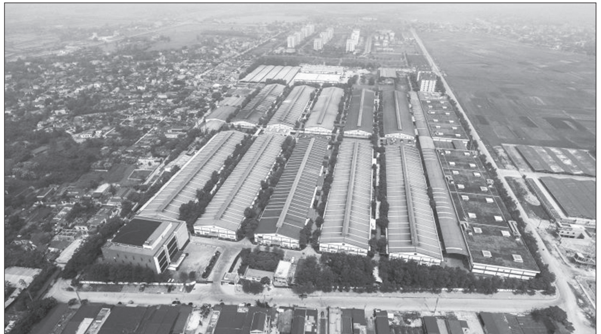
Những dự án trọng điểm trong KKTNS đang nhận được "cú huých" của UBND tỉnh Thanh Hóa về việc gia hạn hoàn tất thủ tục hồ sơ dự án.

Những thành tựu nổi bật trên cho thấy, Thanh Hóa đã có những bước đi đúng đắn, vững chắc trên con đường trở thành cực tăng trưởng mới ở phía Bắc của Tổ quốc. Có thể nói, sau hơn 35 năm đất nước bước vào giai đoạn đổi mới, chưa bao giờ Thanh Hóa có được tiềm lực, vị thế như ngày hôm nay.