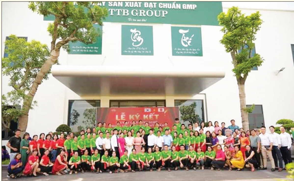
Cán bộ CNV của TTB Group với các đối tác nước ngoài.