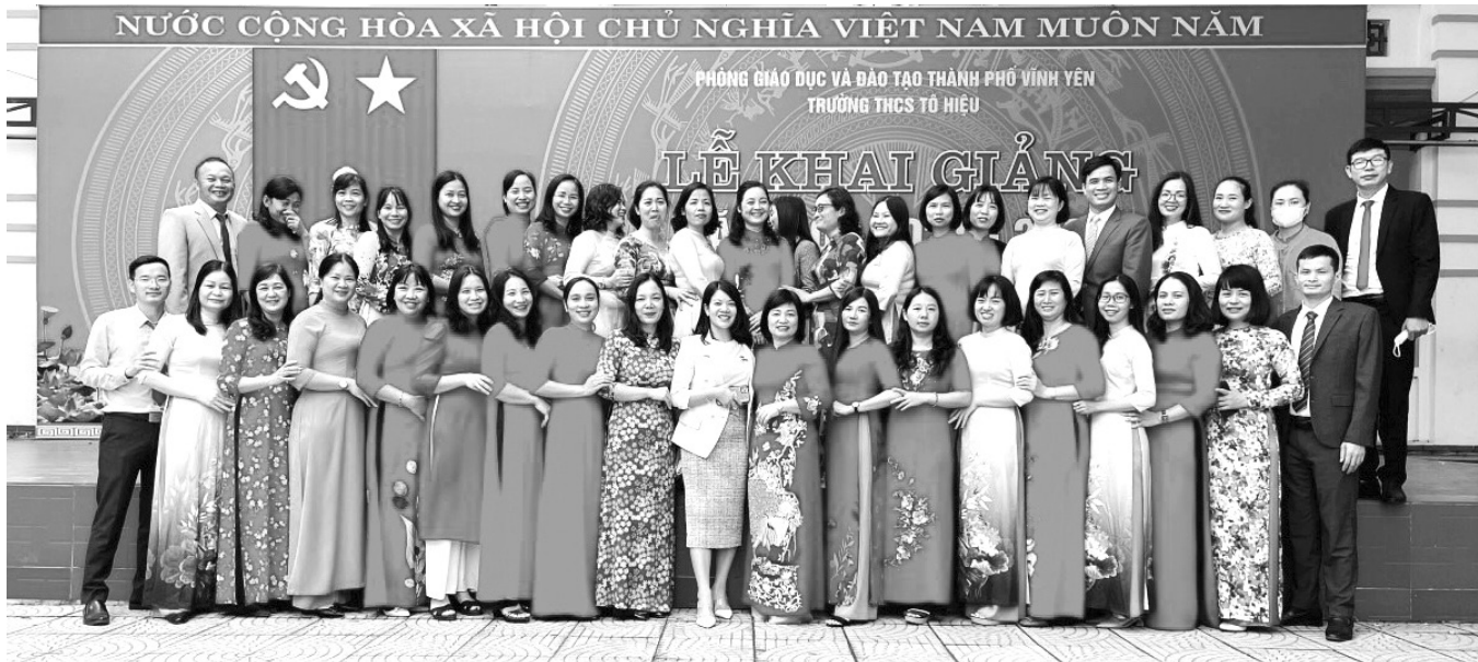
Tập thể cán bộ, giáo viên Trường THCS Tô Hiệu (TP. Vinh Yên, Vinh Phúc).