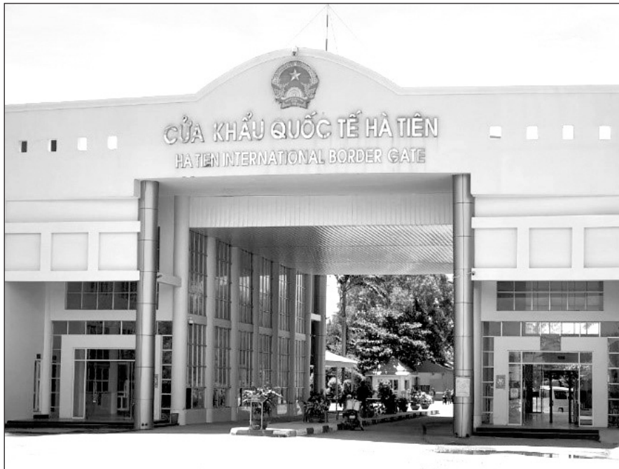
Cửa khẩu Quốc tế Hà Tiên - Kiên Giang.

TRONG BỐI CẢNH CHUNG NỀN KINH TẾ TRONG NƯỚC CŨNG NHƯ THẾ GIỚI BỊ ẢNH HƯỞNG NẶNG NỀ SAU ĐẠI DỊCH COVID-19, HƠN 2 NĂM CẢNG MÌNH CHỐNG DỊCH NHẤT LÀ Ở KHU VỰC BIÊN GIỚI, CỬA KHẨU QUỐC TẾ HÀ TIÊN VẪN LÀ ĐƠN VỊ TÍCH CỰC TRONG VIỆC PHỐI HỢP CHẶT CHẼ VỚI CÁC CƠ QUAN CHỨC NĂNG LIÊN QUAN TRONG NHIỆM VỤ GIỮ VỮNG AN NINH BIÊN GIỚI.