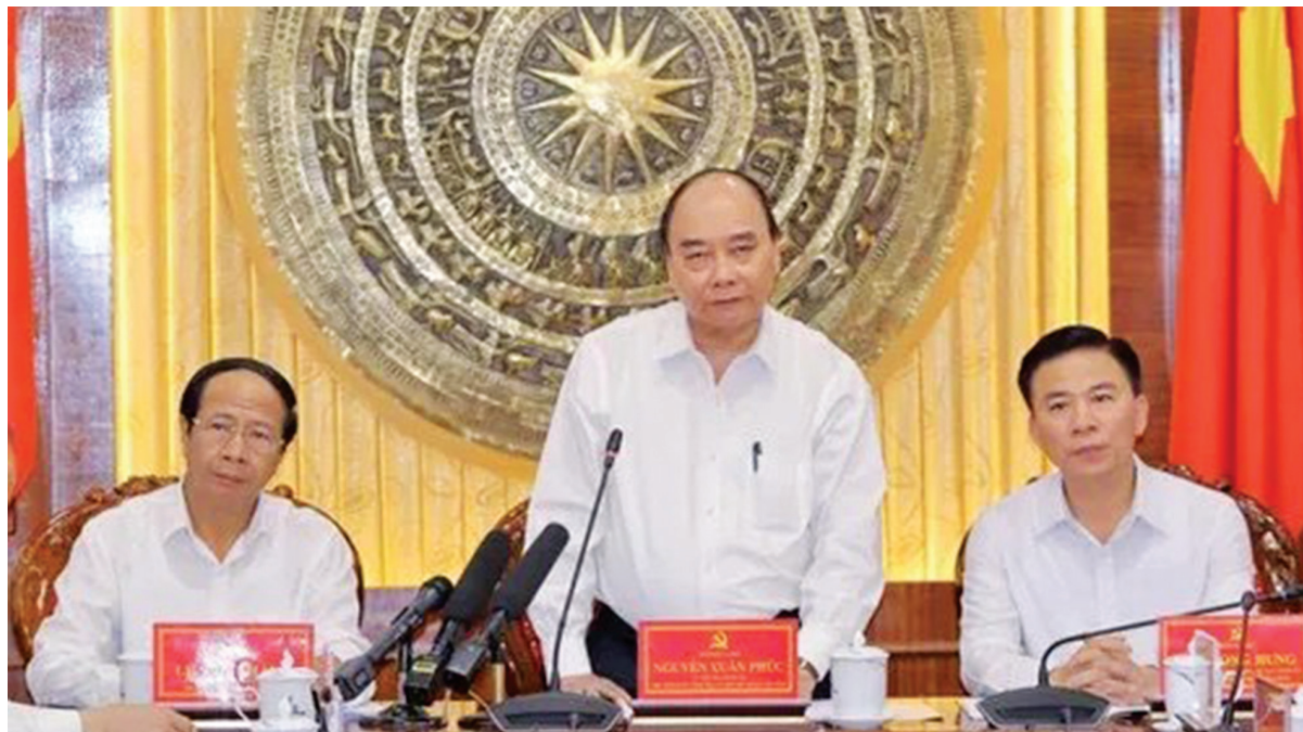
Chủ tịch nước Nguyễn Xuân Phúc làm việc với Ban thường vụ tỉnh Thanh Hóa.

VỚI CÁC TIỀM NĂNG, THẾ MẠNH CÙNG VỊ TRÍ KẾT NỐI THUẬN LỢI CẢ TRONG NƯỚC VÀ QUỐC TẾ, ĐẤT ĐAI RỘNG LỚN, NGUỒN NHÂN LỰC DỒI DÀO, BỜ BIỂN DÀI, CÓ ĐẦY ĐỦ CÁC LOẠI HÌNH GIAO THÔNG, KẾT HỢP CHẶT CHẼ PHÁT TRIỂN KINH TẾ - XÃ HỘI VỚI ĐẢM BẢO QUỐC PHÒNG - AN NINH, BẢO VỆ MÔI TRƯỜNG VÀ HỆ SINH THÁI, TỈNH THANH HOÁ ĐANG ĐỨNG TRƯỚC NHỮNG THỜI CƠ, VẬN HỘI CHƯA TỪNG CÓ TRONG LỊCH SỬ ĐỂ TẠO BƯỚC ĐỘT PHÁ TRONG PHÁT TIẾN KINH TẾ - XÃ HỘI.