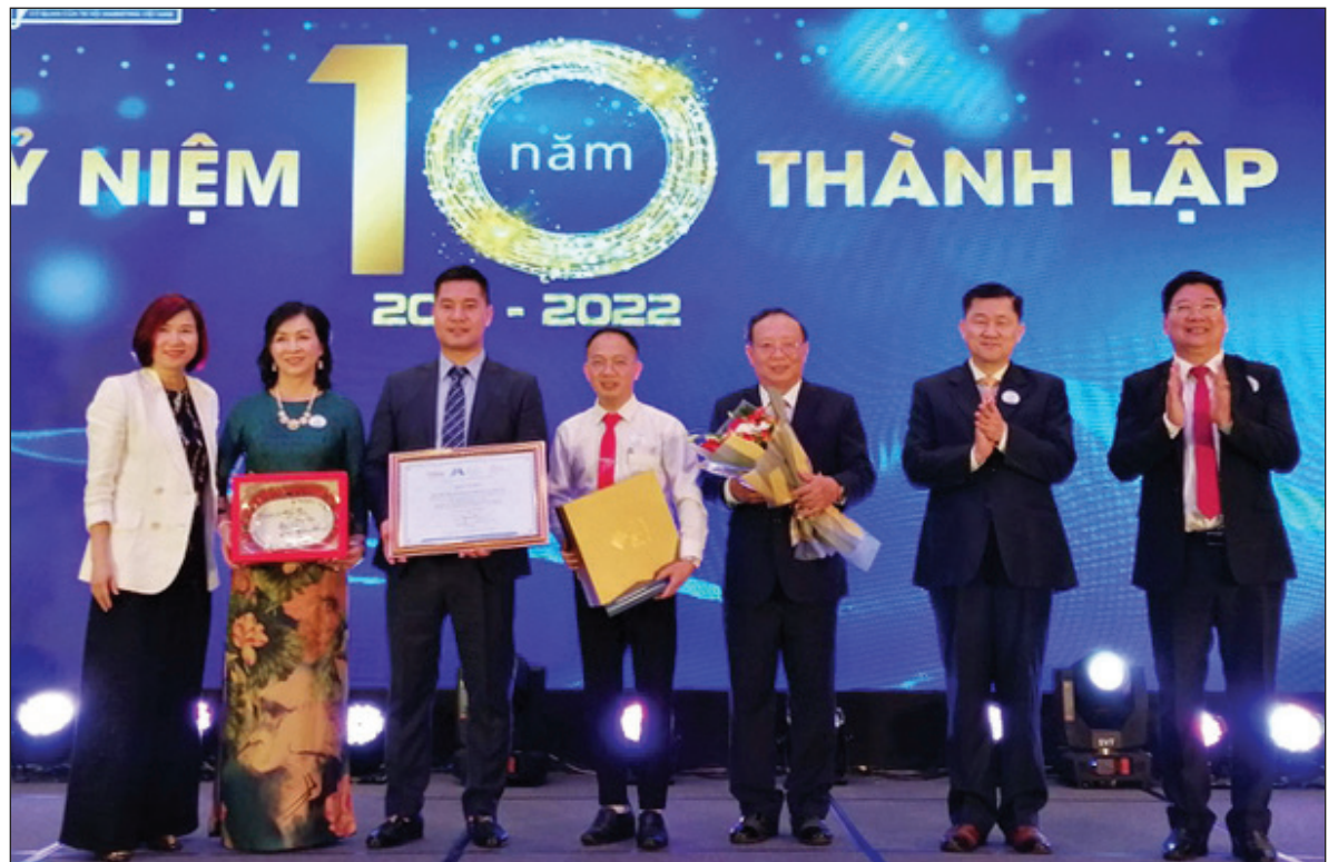
Lãnh đạo Hội Marketing Việt Nam trao giấy khen và Kỷ niệm chương cho Ban biên tập Tạp chí DN&TT.

CÁCH ĐÂY ĐÚNG 10 NĂM, NGÀY 26/9/2012, BÁO KINH DOANH VÀ PHÁP LUẬT (TIỀN THÂN CỦA TẠP CHÍ DOANH NGHIỆP VÀ TIẾP THỊ) ĐÃ RA MẮT SỐ ĐẦU TIÊN. HÃY NHÌN LẠI NHỮNG THÀNH QUẢ ĐẠT ĐƯỢC, CÙNG CHIA SẺ KINH NGHIỆM BƯỚC VÀO HÀNH TRÌNH MỚI.