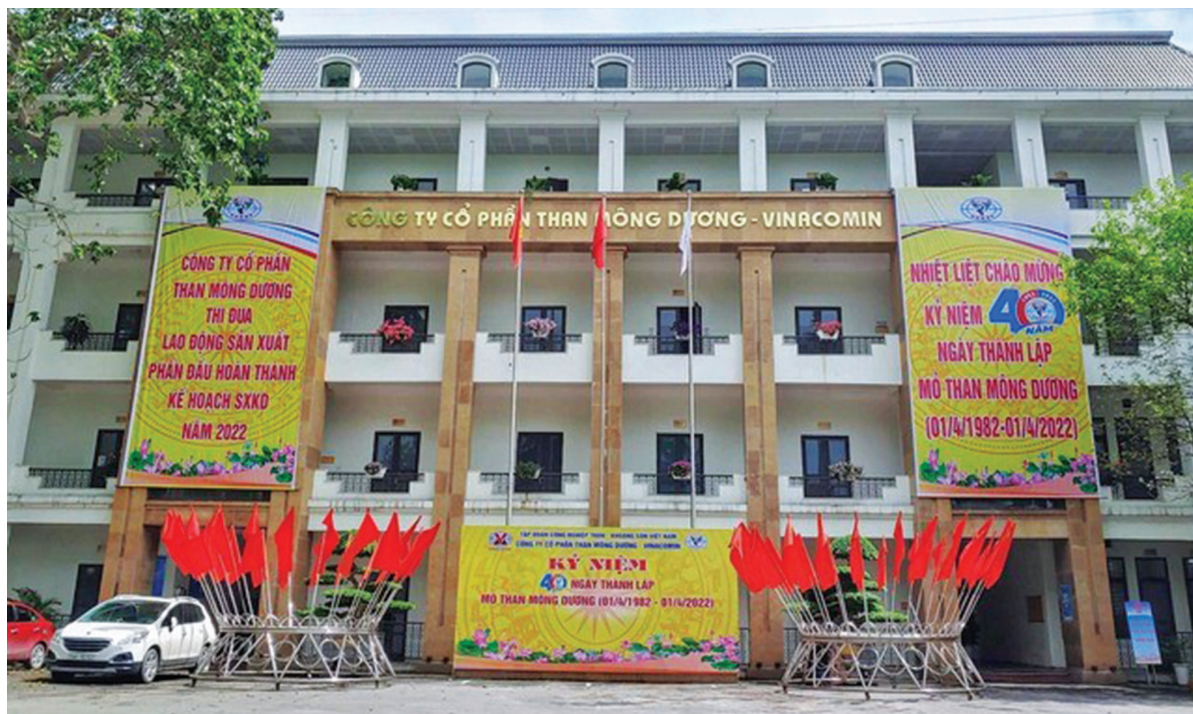
Trụ sở Công ty Cổ phần than Mông Dương - Vinacomin.

Kết thúc 6 tháng đầu năm 2022, sản lượng than khai thác của Công ty CP Than Mông Dương đạt 811 ngàn tấn, bằng 53% kế hoạch