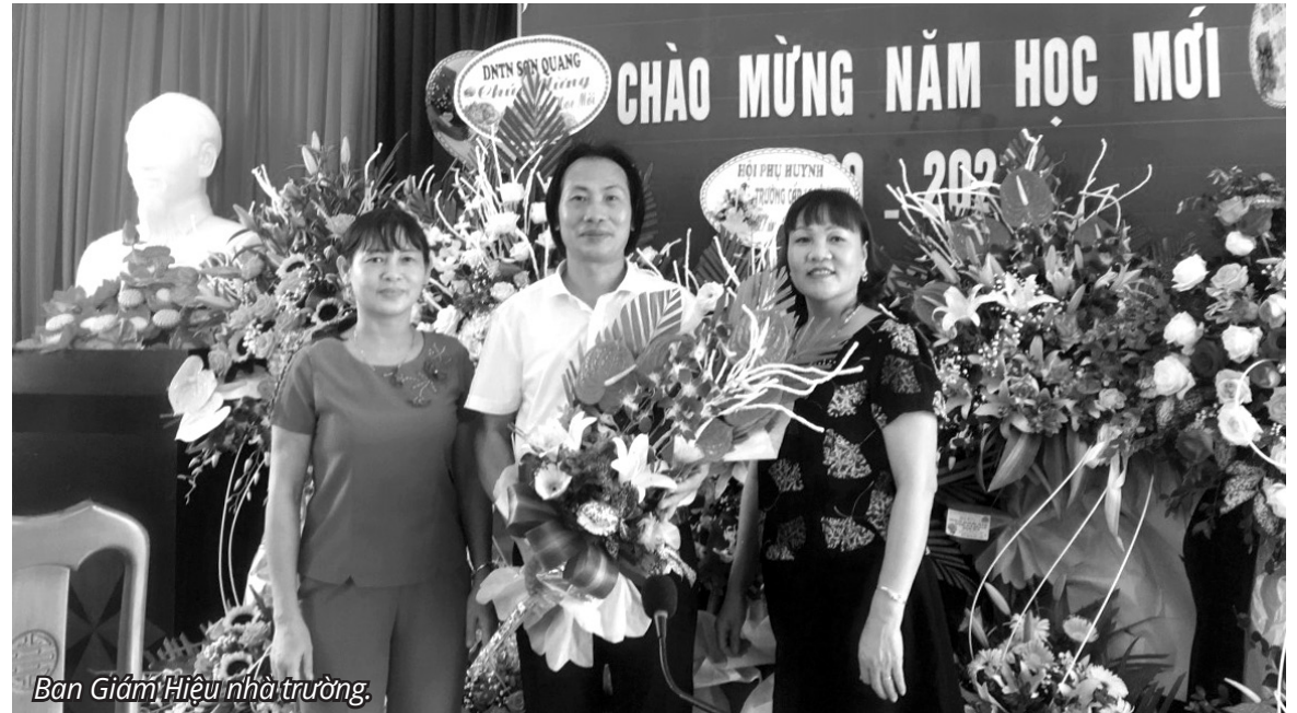
Ban Giám Hiệu nhà trường.

VỚI TINH THẦN CHỦ ĐỘNG, SÁNG TẠO, QUYẾT LIỆT VÀ LINH HOẠT TRONG CÔNG TÁC CHỈ ĐẠO, TRƯỜNG TIỂU HỌC YÊN NINH (XÃ YÊN NINH, HUYỆN Ý YÊN, TỈNH NAM ĐỊNH) ĐÃ CHUẨN BỊ ĐẦY ĐỦ CÁC ĐIỀU KIỆN VỀ CƠ SỞ VẬT CHẤT SẴN SÀNG CHO NĂM HỌC MỚI 2022-2023.