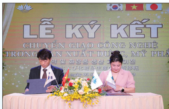
Lễ ký kết giữa TTB Group với đại diện Tập đoàn công nghệ Korea - Hàn Quốc.

CÔNG TY TNHH DƯỢC PHẨM QUỐC TẾ TTB GROUP ĐƯỢC HÌNH THÀNH TỪ NĂM 2015 ĐÃ DẪN KHẲNG ĐỊNH VỊ THẾ TRÊN THỊ TRƯỜNG TRONG NƯỚC VÀ QUỐC TẾ.