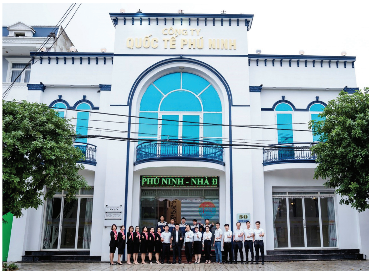
Giám đốc Công ty TNHH Đầu Tư Quốc tế Phú Ninh - Chủ đầu tư Dự án Đầu tư xây dựng kinh doanh kết cấu hạ tầng kỹ thuật Cụm công nghiệp Hòa Bình.

Chịu trách nhiệm trước pháp luật về tính trung thực, chính xác của các thông tin, số liệu, nội dung về hồ sơ dự án và hiệu quả đầu tư dự án. Trường hợp Công ty TNHH Đầu tư Quốc tế Phú Ninh không thực hiện đúng các quy định nêu trên, Sở Kế hoạch và Đầu tư phối hợp với UBND huyện Phú Ninh và các cơ quan liên quan xem xét, xử lý theo thẩm quyền hoặc trình UBND tỉnh giải quyết theo quy định của pháp luật.