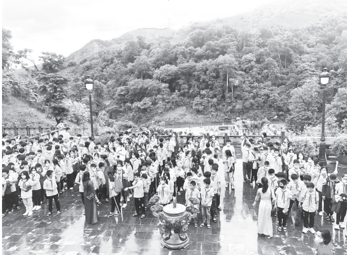
Phòng GD&ĐT huyện Phù Yên – Sơn La luôn giữ vững vị trí trong việc xây dựng các kế hoạch để nâng cao chất lượng dạy và học trên địa bàn.

Các cơ sở giáo dục đã phối hợp chặt chẽ với trung tâm y tế huyện, các trạm y tế xã, thị trấn tổ chức thành công chiến dịch tiêm vắc-xin phòng dịch cho người học theo hướng dẫn của Bộ Y tế; thường xuyên cập nhật số liệu tiêm phòng COVID-19 cho học sinh, trẻ em từ 5 tuổi đến dưới 12 tuổi và học sinh từ 12 đến 18 tuổi ở các địa phương nhằm đẩy mạnh tiến độ tiêm chủng cho học sinh; triển khai hiệu quả công tác tuyên truyền giáo dục sức khỏe, phòng,