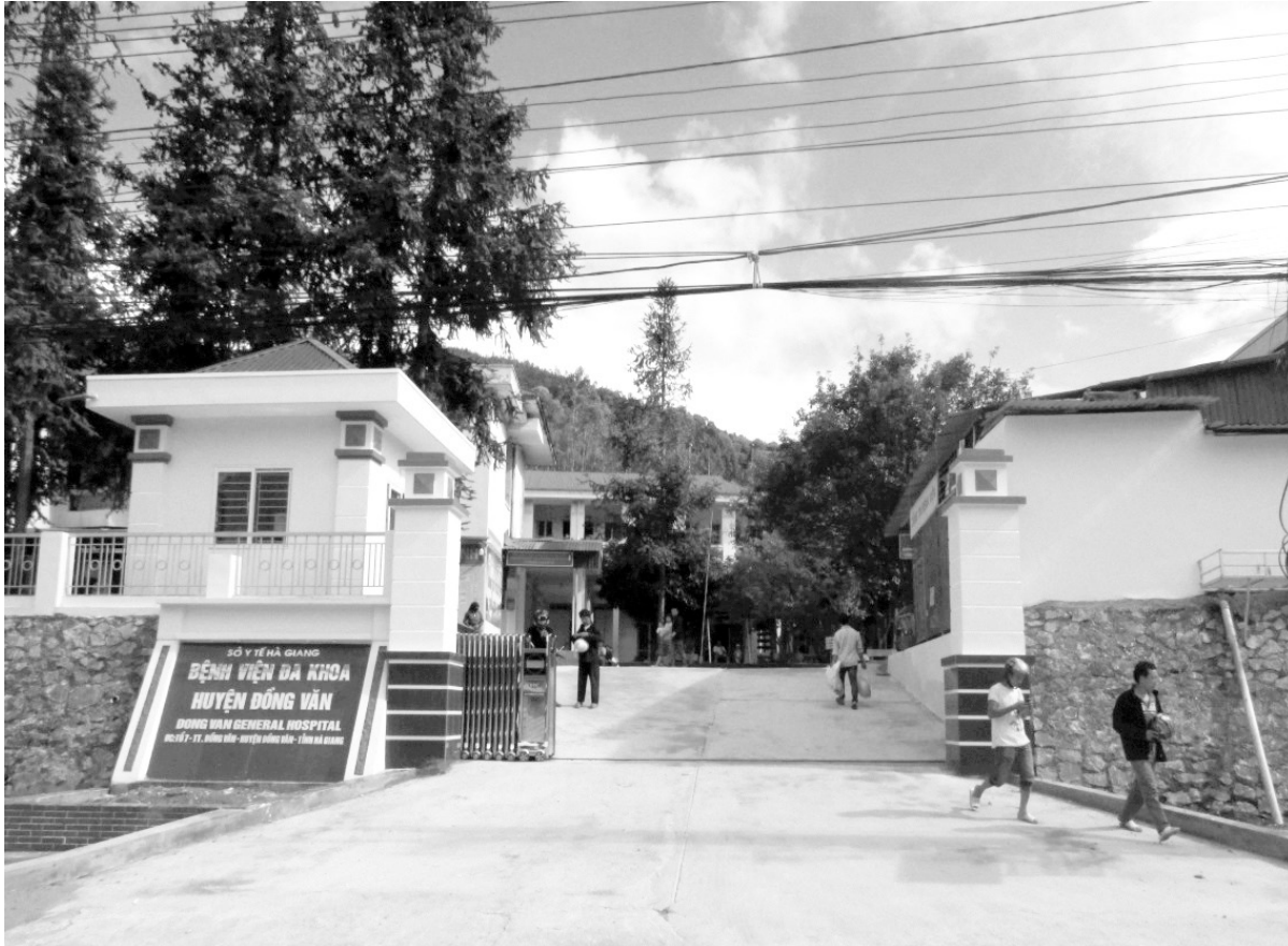
Trụ sở Bệnh viện Đa khoa huyện Đồng Văn.

B ệnh viện Đa khoa huyện Đồng Văn được giao với quy mô 100 giường, gồm: 23 khoa, phòng và 2 phòng khám đa khoa khu vực với tổng số 108 cán bộ, viên chức, người lao động. Trong đó có 29 bác sĩ, 13 y sĩ, 31 điều dưỡng, 7 dược sĩ, 5 kỹ thuật viên và nhiều cán bộ, nhân viên khác.