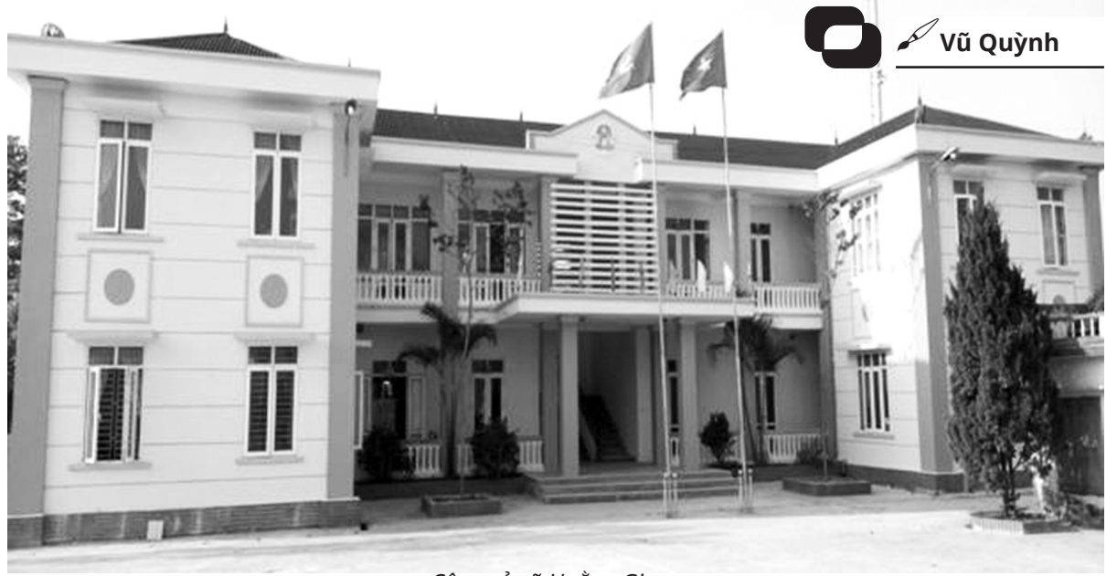
Công sở xã Hoàng Giang

Để đáp ứng các tiêu chí NTM và tiêu chuẩn về hệ thống cơ sở hạ tầng đồng bộ, trong những năm qua, xã Hoàng Giang đã chỉ đạo, thực hiện tốt công tác quản lý nhà nước về đầu tư xây dựng cơ bản; quản lý xây dựng các công trình theo Nghị quyết của HĐND; 6 tháng đầu năm hỗ trợ 4 thôn khảo sát, lập dự toán, triển khai thi công, nghiệm thu hệ thống đường giao thông, rãnh thoát nước khu dân cư với chiều dài 710m; thảm nhựa 103m đường thôn Trinh