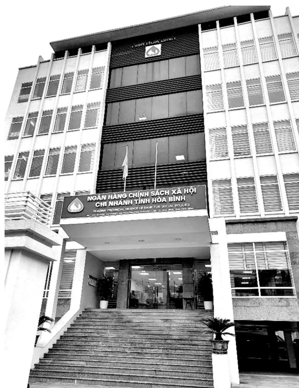
Trụ sở Ngân hàng Chính sách xã hội chi nhánh tỉnh Hòa Bình.

Cũng trong thời kỳ khó khăn nhất của đất nước đó là ảnh hưởng của dịch Covid-19, đã có 26 cơ sở sản xuất kinh doanh trên địa bàn được vay vốn với lãi suất 0% để trả lương cho 3.105 lượt lao động phải nghỉ việc tạm thời; đồng thời thực hiện và triển khai kịp thời Nghị quyết số 11/NQ-CP ngày 20/01/2022 của Chính phủ đã giúp cho 2.034 lao động có vốn để tạo, duy trì và mở rộng việc làm; 159 khách hàng được vay vốn để mua nhà ở xã hội, xây dựng và cải tạo nhà ở; 955 học sinh sinh viên có tiền mua máy tính, thiết bị học trực tuyến; 13 cơ sở giáo dục mầm non ngoài công lập được vay vốn để mua sắm trang thiết bị, vật tư y tế phòng chống dịch. Và còn rất nhiều hộ gia đình tuy chưa thoát khỏi khó khăn về kinh tế, song nhờ nguồn vốn vay ưu đãi đã có cơ hội làm chủ cuộc sống của mình. Đó chính là hiệu quả kinh tế - xã hội đem lại từ chính các chương trình tín dụng chính sách trong thời gian qua.