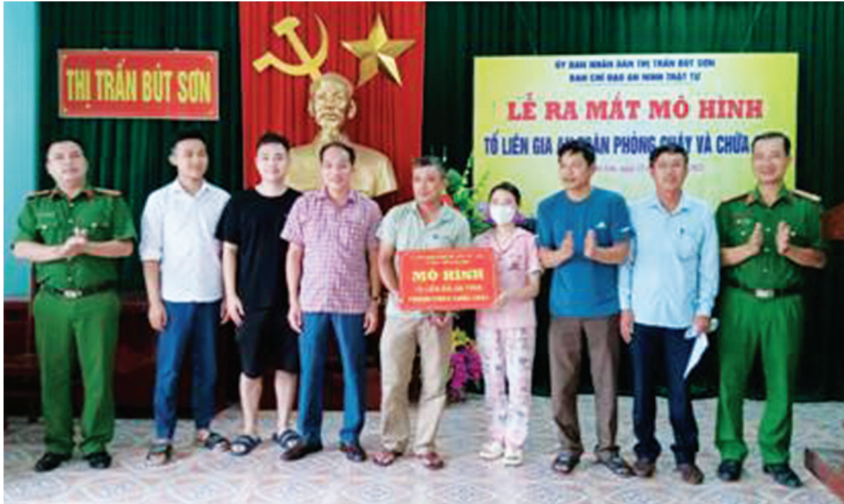
Tổ liên gia an toàn PCCC của thị trấn Bút Sơn.

thực hiện tốt công tác PCCC đó là: Trước hết các thành viên Ban chỉ đạo, Tổ liên gia và toàn thể cán bộ, công chức làm tốt công tác tuyên truyền, vận động, hướng dẫn người dân nâng cao nhận thức về PCCC và thực hiện mô hình "Tổ liên gia an toàn phòng cháy và chữa cháy"; các hộ gia đình sản xuất và kinh doanh phải chủ động mua sắm trang bị các thiết bị PCCC; Ban công an tham mưu mở các lớp huấn luyện nghiệp vụ PCCC cho Tổ liên gia, tổ trưởng các tổ dân phố; tăng cường kiểm tra, kiểm soát công tác PCCC tại các hộ gia đình sản xuất kinh doanh và ký cam kết chặt chẽ với các hộ; xử lý nghiêm các hộ gia đình sản xuất kinh doanh không chấp hành tốt công tác PCCC.