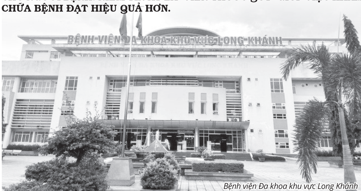
Bệnh viện Đa khoa khu vực Long Khánh

Với phương châm “Vì người bệnh, vì tập thể, vì mỗi chúng ta”, Bệnh viện Long Khánh đang hướng tới mục tiêu trở thành bệnh viện đa khoa chuyên sâu toàn diện, là bệnh viện hạng I của tỉnh Đồng Nai với tầm nhìn chiến lược: “Bệnh viện Long Khánh - nơi khởi nguồn yêu thương sẻ chia và thông cảm, đảm bảo cung ứng mọi dịch vụ y tế tốt nhất, là đơn vị hàng đầu trong khu vực”.