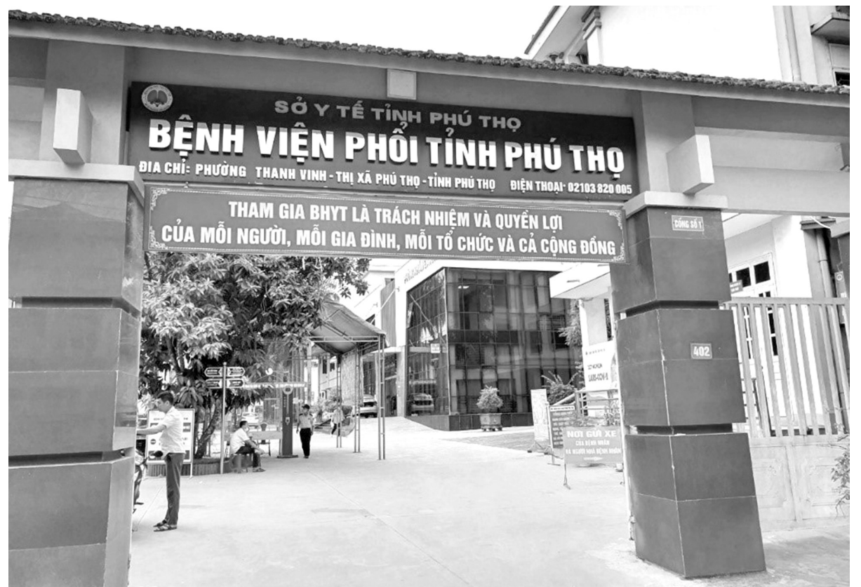
Trụ sở Bệnh viện Phổi tỉnh Phú Thọ.

tạo để thực hiện thành thạo các kỹ thuật lâm sàng và cận lâm sàng mới tại các bệnh viện tuyển Trung ương, tăng cường ký hợp đồng hợp tác với các chuyên gia của các bệnh viện tuyển trên theo hình thức chuyên gia, hỗ trợ đào tạo, chuyển giao kỹ thuật cho cán bộ Bệnh viện. Việc đầu tư nâng cấp cơ sở hạ tầng, phần mềm hệ thống công nghệ thông tin của Bệnh viện, ứng dụng công nghệ thông tin vào toàn diện các hoạt động của Bệnh viện được đẩy mạnh hơn nữa và chú trọng đảm bảo chế độ, quyền lợi cho những bệnh nhân tham gia BHYT. Ban lãnh đạo còn quản lý, quán triệt việc thực hiện nghiêm túc quy tắc, kỹ năng giao tiếp ứng xử, ý thức và tinh thần thái độ phục vụ người bệnh của mọi cán bộ, viên chức lao động của Bệnh viện, tạo môi trường xanh sạch đẹp góp phần nâng cao hơn nữa sự hài lòng của người bệnh”.